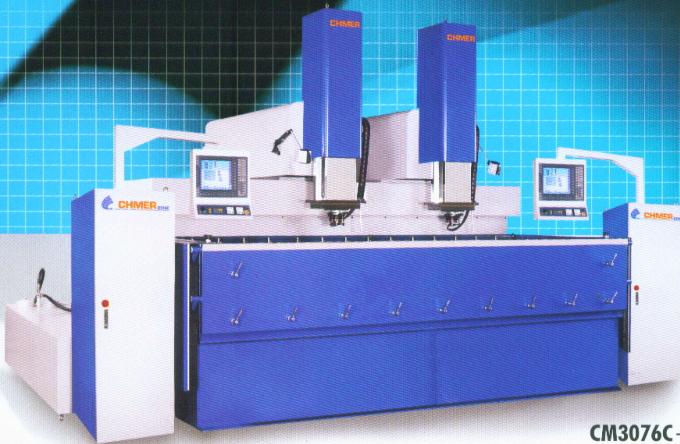
CM3076C+75N (A)+75N (A) ( 雙頭部 )